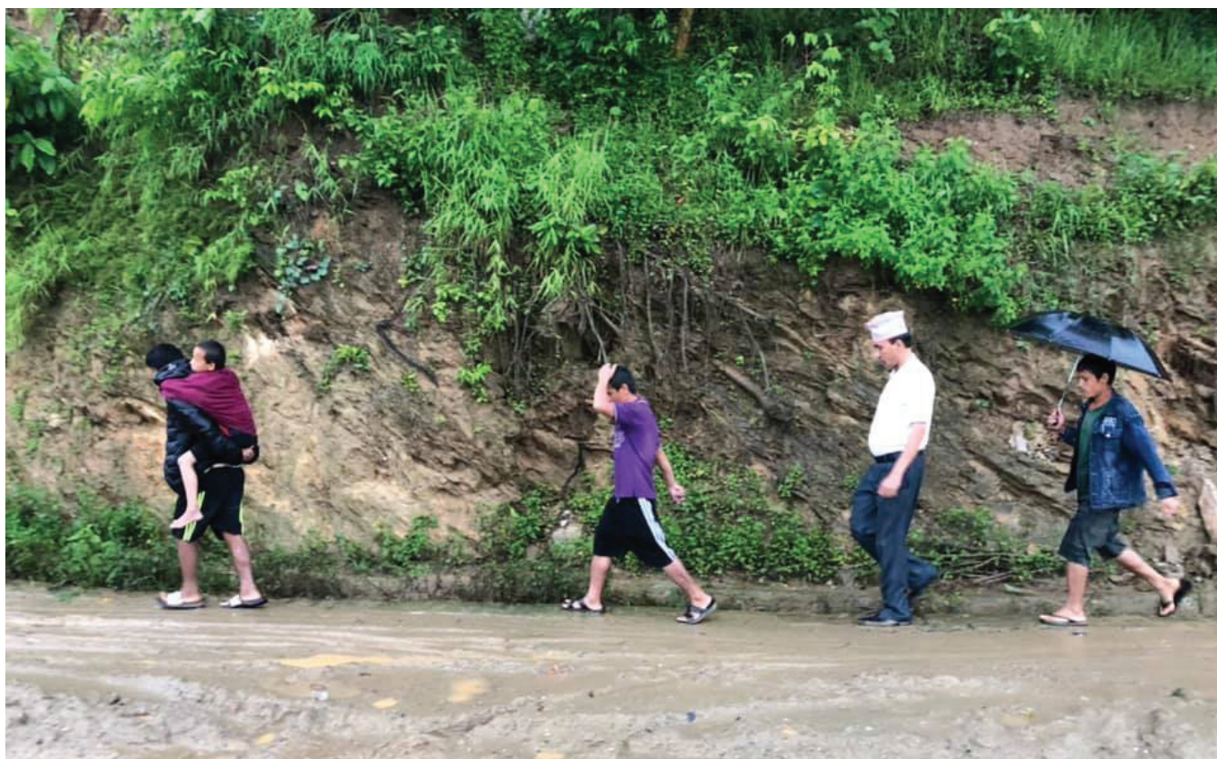
९० गजुरी गाउँपालिकाको कार्यालय - २०७६